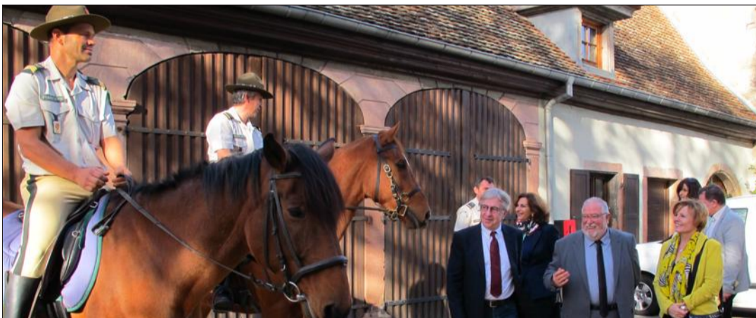
Jean-Pierre Masseret, tête de liste PS aux régionales en ACAL, a découvert, dimanche matin à Soultz, le fonctionnement et les missions de la Brigade verte du Haut-Rhin.

Enthousiaste, Jean-Pierre Masseret a assuré le personnel de son soutien : « Bravo ! Vous faites du bon