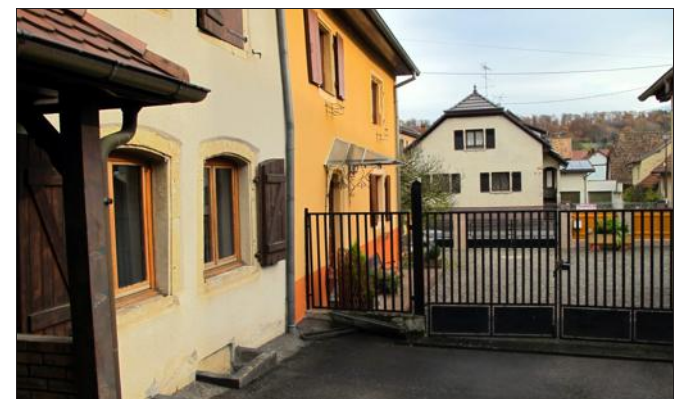
Les locaux de la Brigade verte (au premier plan, à gauche). Impossible d'y accéder en voiture avec le portail fermé installé par les propriétaires de la maison jaune située en contrebas.